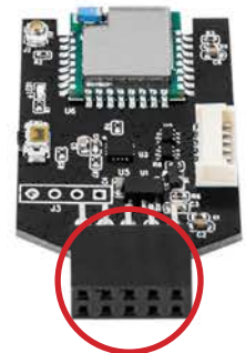
内建 USB 2.0 9 pin