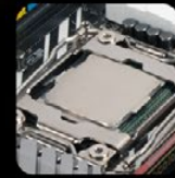
Intel LGA 2066 & 2011