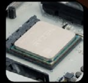
AMD Socket AM4