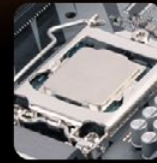
Intel LGA 1200 & 115x