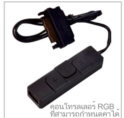
คอนโทรลเลอร์ RGB ที่สามารถกำหนดค่าได้