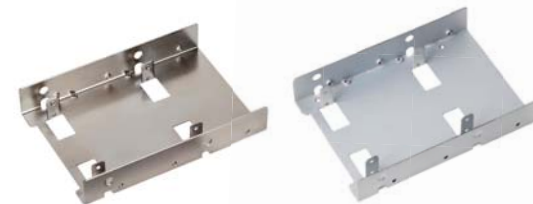
SDP08 / SDP08-LITE 3.5" - 2.5" 베이 컨버터