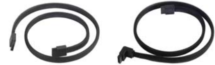
CP07+CP08 CP07+CP08 SATAIII 케이블은 일반 SATA장치와 완벽하게 호환됩니다.