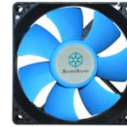
SST-SUSCOOL81 PS09에 Suscoo81 사용하면, 정숙성과 성능의 궁극적인 조화를 이룰 수 있습니다.