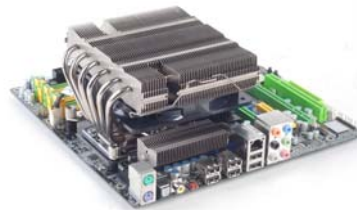
NT06-PRO 대부분의 모든 사용환경을 만족시키는 유연성을 지닌 최상의 히트 싱크