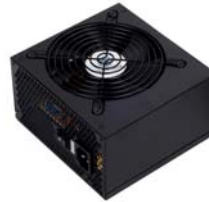
ST40F-ES 적절한 가격의 고품질 400W PSU