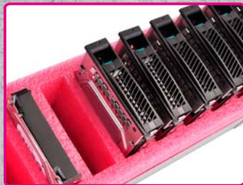
Spazio supplementare per l'alloggiamento simultaneo di dischi rigidi da 3,5" e cassette hot-swap