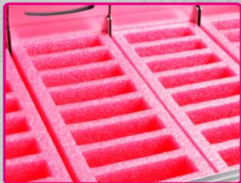
Alloggiamento per disco rigido 5U per quaranta dischi rigidi da 3,5"

* Si adatta alla guida di scorrimento ad incastro – RMS03-24