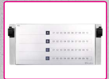
Etichettatura sul pannello anteriore per una comoda gestione