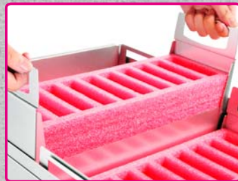
Materiale imbottitura antiurto in polietilene antistatico