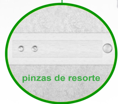
pinzas de resorte