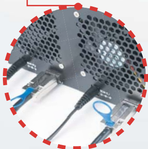
Connecter le Mini-SAS SFF-8088 et l'adaptateur secteur au stockage externe