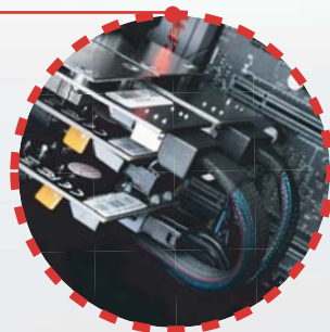
Connecter l'adaptateur Mini-SAS et les câbles internes de l'adaptateur secteur