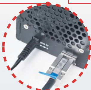
Collegare i cavi esterni dell'adattatore Mini-SAS e dell'adattatore di alimentazione