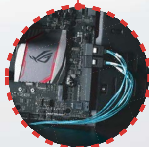
Collegare CPS03-RE alle porte SATA della scheda madre